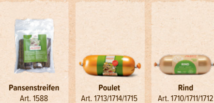
Pansenstreifen Art. 1588