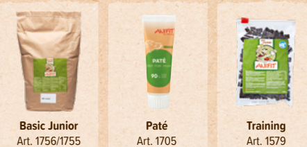
Basic Junior Art. 1756/1755

Für eine schnelle und punktgenaue Belohnung ist es wichtig, dass das Leckerli gut in der Hand liegt und vom Hund schnell geschluckt werden kann. Langes Kauen sollte vermieden werden.