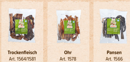
Trockenfleisch Art. 1564/1581